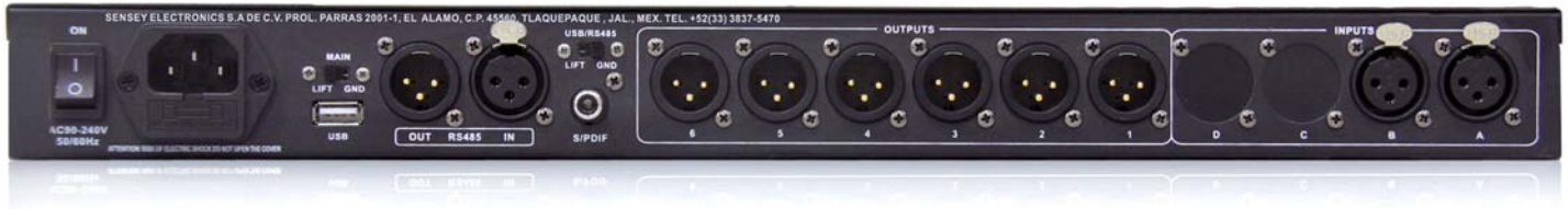
• vista posterior